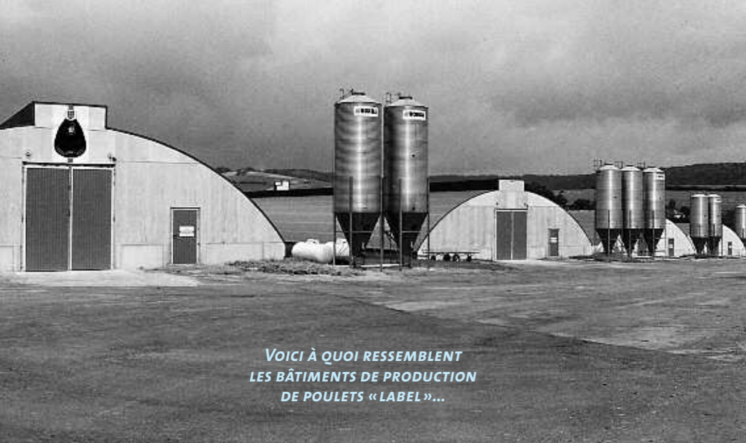
VOICI À QUOI RESSEMBLENT LES BÂTIMENTS DE PRODUCTION DE POULETS « LABEL »...