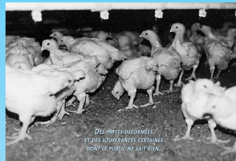
DES PATTES DÉFORMÉES ET DES SOUFFRANCES CERTAINES DONT LE PUBLIC NE SAIT RIEN.

Merci de considérer les animaux comme des êtres sensibles.