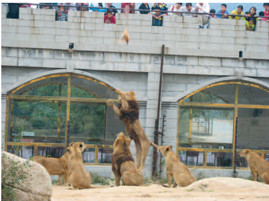
Un jeu cruel : Au Bedaling Safari Park, les visiteurs titillent les grands félins avec des poulets vivants attachés à des perches : celui-ci a subi cinq minutes de terreur avant d'être attrapé et dévoré vivant.

En Chine, les animaux des zoos, de même que n'importe quel animal domestique ou de compagnie, ne bénéficient d'absolument aucune protection légale, et cependant, c'est ce pays qui décide de se servir de ses Jeux Olympiques pour se présenter comme le grand leader économique novateur du XXI e siècle. Comme l'illustre ce rapport, en matière de zoos, la Chine en est encore au Moyen Âge.