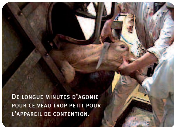
DE LONGUES MINUTES D'AGONIE POUR CE VEAU TROP PETIT POUR L'APPAREIL DE CONTENTION.

– Un petit bouc, visiblement très stressé, est si petit que sa tête dépasse à peine de l'appareil de contention. C'est donc finalement la tête plaquée sur une grille par un employé qu'il sera égorgé sans aucune délicatesse.