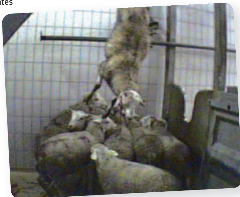
UN MOUTON QUI SE VIDE DE SON SANG SUR SES CONGÉNÈRES AFFOLÉS.

La participation des particuliers et même d'enfants au processus est non seulement illégale mais dangereuse. Quant aux coups portés, ils relèvent de la maltraitance pure. Qu'ils soient le fait d'enfants considérant l'abattoir comme un terrain de jeux la rend d'autant plus inacceptable. Le respect s'apprend dès le plus jeune âge. Quels adultes risquent de devenir des enfants pour lesquels la souffrance est banalisée et la violence encouragée ?