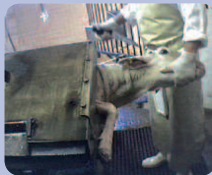
DES MOUTONS MAL POSITIONNÉS ENDURENT UNE MORT ENCORE PLUS DOULOUREUSE.

aussi de stabiliser la tête de l'animal. C'est finalement avec son genou qu'il parvient à la bloquer. Il tranche ou plutôt cisaille ensuite la gorge de l'animal d'au moins 4 coups de couteau et le libère. Le veau se redresse immédiatement et dans un ultime effort parvient à ramener sa tête à l'intérieur du piège où, haletant, il agonisera de longues minutes.