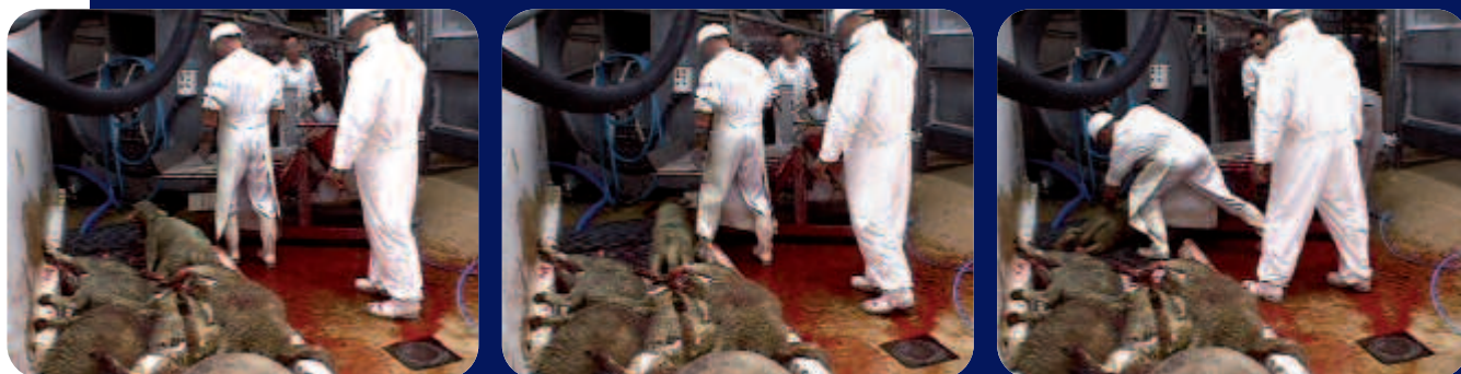
MAL ÉGORGÉ, UN MOUTON TENTE DE FUIR...

« [...] il est temps pour la société islamique de faire le point sur son attitude à l'égard des animaux [...]. Il existe un besoin pressant d'améliorer la façon dont ils sont traités, dans les abattoirs en particulier, et de mieux les traiter en général. En s'acquittant consciencieusement de ce devoir, les